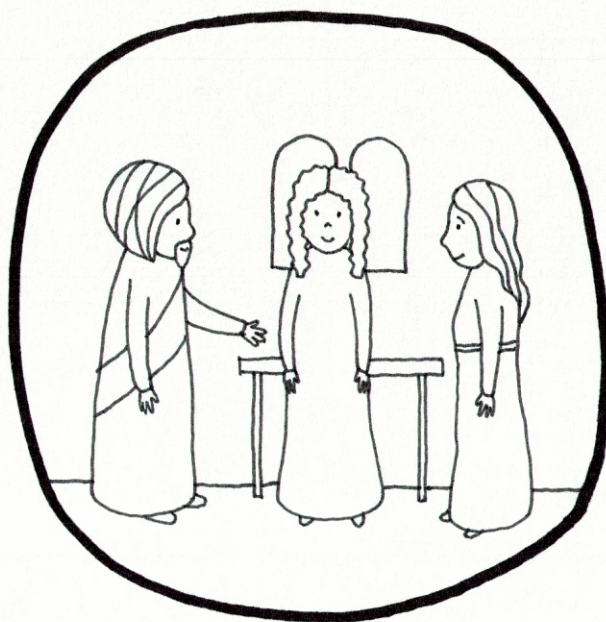
④ Ježiš jej odpovedal: „Marta, Marta, staráš sa a znepokojuješ pre mnohé veci, a potrebné je len jedno. Mária si vybrala lepší podiel, ktorý sa jej neodníme.“