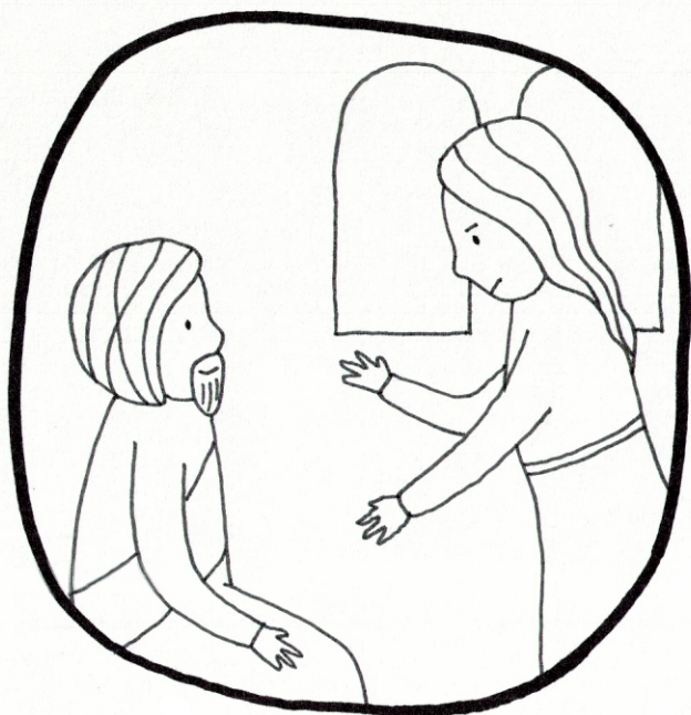
③ Marta sa hnevá a chce, aby Ježiš povedal Márii, aby jej pomohla.