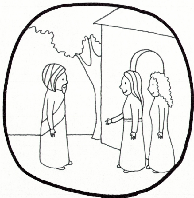
① Marta pozvala Ježiša do svojho domu.

evanjelium pre deti v obrázkoch Lk 10, 38-42