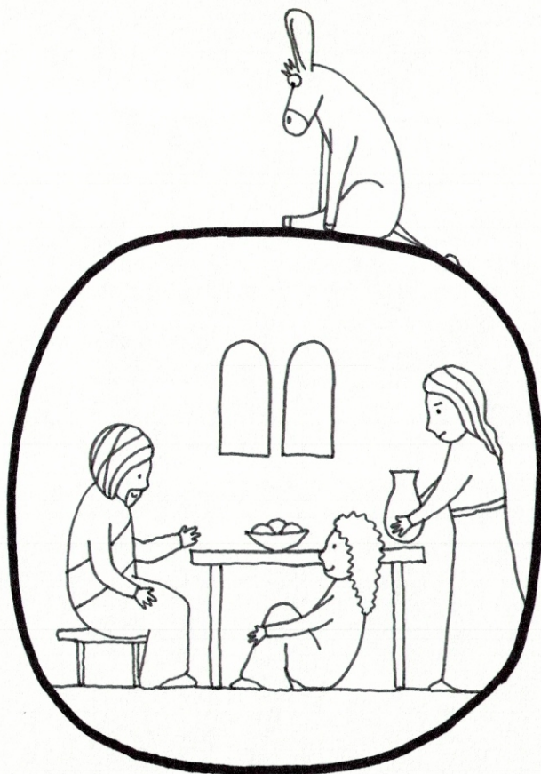
② Pokým Marta obsluhovala, jej sestra Mária počúvala Ježiša.